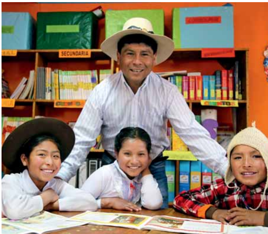
Programa de Recursos Educativos Las Bambas (PREB) mejora la calidad educativa en diecinueve comunidades aledañas a nuestra operación.

Asimismo, redujimos el monto destinado a actividades de construcción y desarrollo debido a que ingresamos a nuestra etapa operativa e iniciamos actividades comerciales.