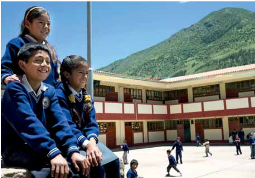
Como asociación civil, el Fondo Social Las Bambas ha implementado proyectos de desarrollo en beneficio de la población de las provincias de Cotabambas y Grau.