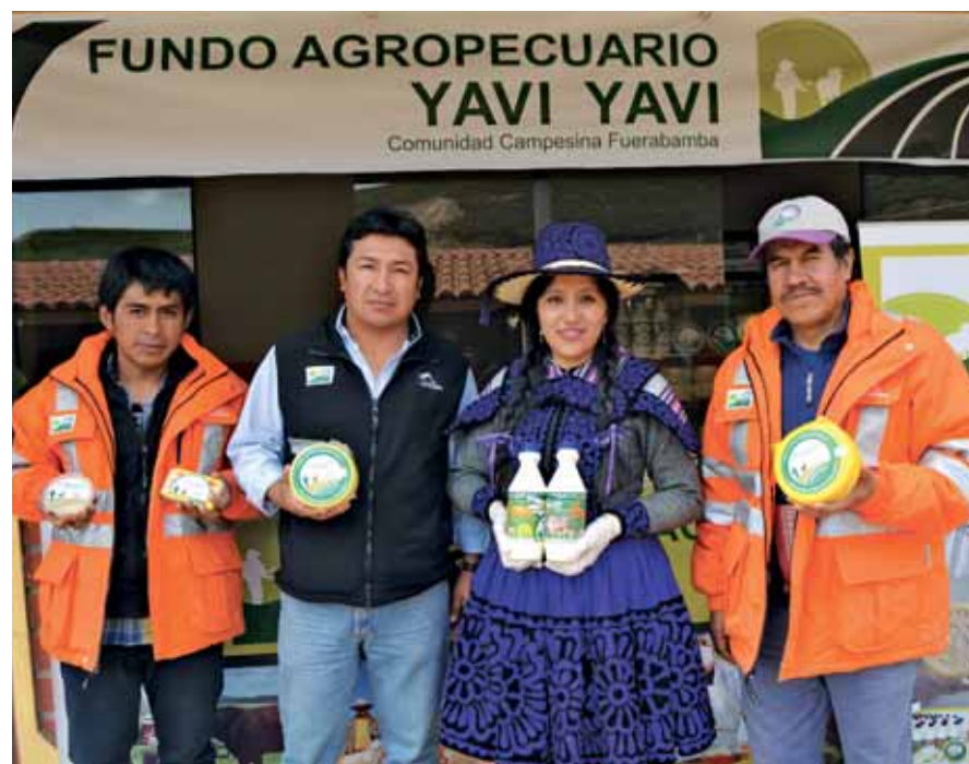
Como parte del programa de reasentamiento, el Fundo Yavi Yavi reúne a las especies pecuarias de las familias de la comunidad de Fuerabamba, con la finalidad de lograr un manejo eficiente y mejorar la producción láctea.